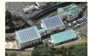
みんなの発電所 コミュニティソーラー