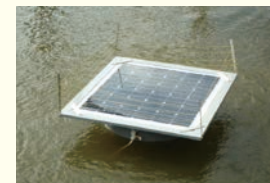
ソーラー水浄化装置